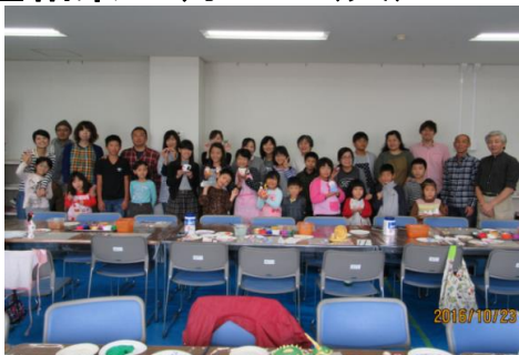
掲載の写真は昨年の一部作品と参加者