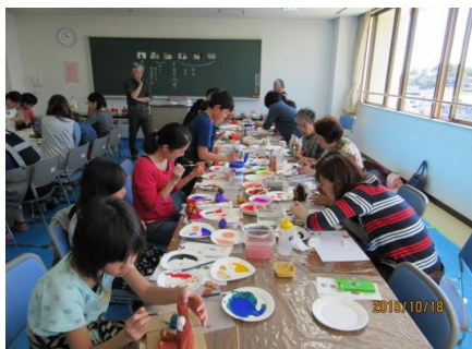
掲載の写真は昨年の一部作品と参加者

(お申込・お問合せ先) 〒814-0142 福岡市城南区片江5丁目3-25 城南市民センター「博多人形づくり教室」係 ☎:092-862-2141 FAX:092-862-2801 (主催)指定管理者 九電ビジネスフロント・九州メンテナンスJV